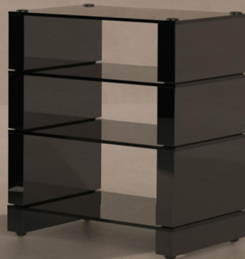
Stax 2G - polica 4 etaže