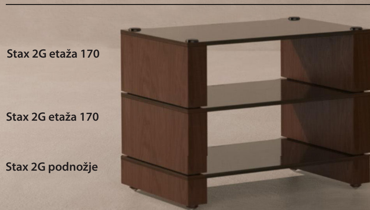
Stax 2G - polica 3 etaže

Modernistički Hi-Fi namještaj s mogućnošću punjenja apsorpcijskim materijalima, dostupan u dvije posebno odabrane inačice